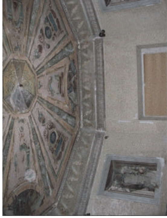
Torreón del Duque. Fot. sin fecha