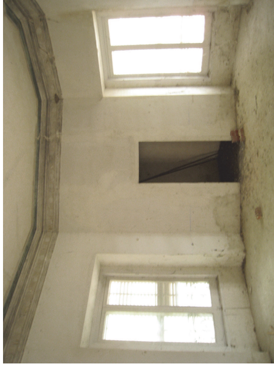
Torreón noreste. Fot. Junio 2008

La crujía norte es una gran sala entre los torreones de la Duquesa y el noreste. Para poder acceder a esta sala sin atravesar los torreones, en la época de los Bauer se achafaló el patio norte en ambas esquinas, generando unos elementos añadidos al proyecto original.