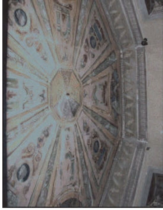
Pintura mural del techo del gabinete del Duque. Fot. sin fecha

Un segundo proyecto, entregado al ayuntamiento en el año 1990, tenía como objetivo finalizar las obras de palacio. En él ya se planteaban los futuros usos del edificio para exposiciones, actividades culturales y archivo de los jardines. El proyecto se inició con la restauración de las pinturas de los torreones, la distribución inicial de los espacios y la ejecución de las instalaciones básicas. Este proyecto quedó sin concluir al finalizar la escuela taller en 1993.