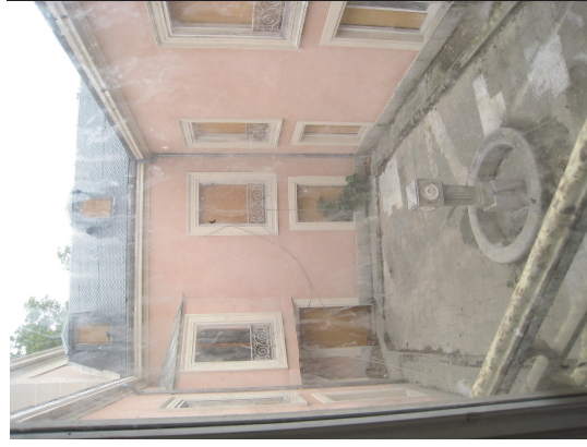
Patio norte, achaflanado en planta primera y escalera de acceso a bajo cubierta. Fot. Junio 2008