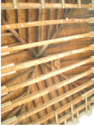
Planta tercera del torreón sureste y estructura de cubierta. Fot. Junio 2008

Existen aún elementos artísticos dentro de palacio que es necesario restaurar: los suelos de azulejos, principalmente el del comedor que representa la batalla de Issos, el propio comedor, las escaleras de todo el palacio, y las pinturas de los torreones son elementos históricos a los que hay que prestar una dedicación especial.