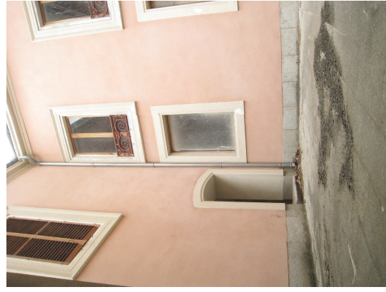
Patios sureste y suroeste. Fot. Junio 2008

Esta planta tiene 600 m 2 incluyendo la ocupación de las escaleras que descienden al comedor.