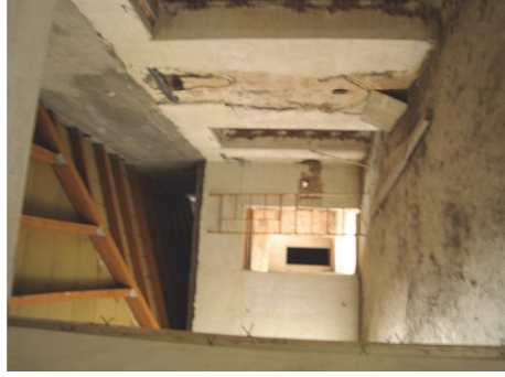
Vistas de las salas de la crujía central en planta primera hacia las antecámaras de la Duquesa y del Duque, donde se aprecian los huecos a la fachada del jardín. Fot. Junio 2008