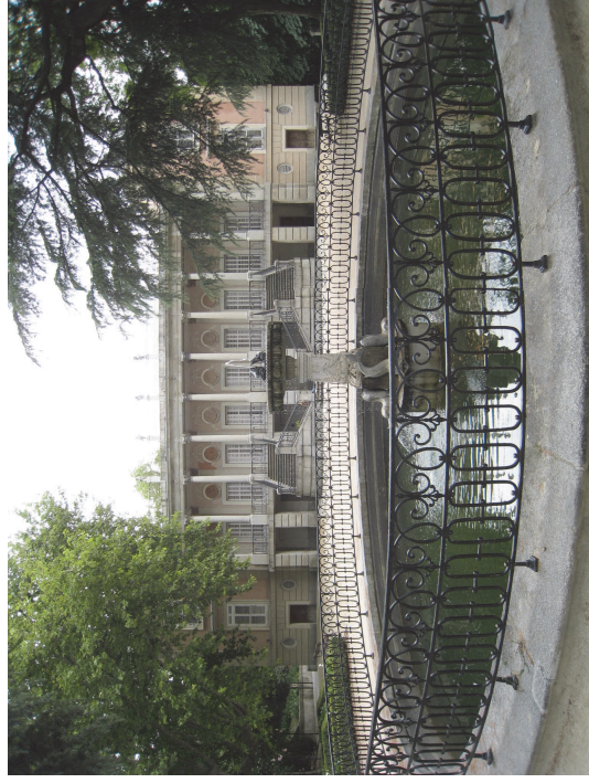
Vista de la fachada de palacio al jardín. Fot. Junio 2008

jardín y en los “caprichos”, es decir, el respeto al estilo arquitectónico del edificio así como a sus materiales. Se suprimieron exclusivamente las actuaciones que significaron una incongruencia histórica o una evidente degradación estética.