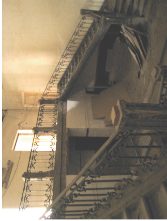
Vista del zaguán de palacio. Fot. Junio 2008

En planta baja el zaguán, al que podían acceder carruajes, es la pieza que articula las circulaciones, dando acceso a todas las estancias del ala este que da a la C/ de la Rambla, entre los torreones noreste y sureste, donde antiguamente se situaba la zona de cocinas, que se comunicaba a través de un hueco con el comedor.