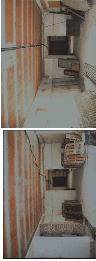
Vistas de las salas de la crujía central en planta baja. Fot. Junio 2008

Desde el zaguán también se accede a la crujía central, entre el ala este y oeste, la cual está compartimentada en 4 salas, y desde las dos últimas a otras dos, una al norte y otra al sur, abriendo todas ellas sus huecos a los patios.