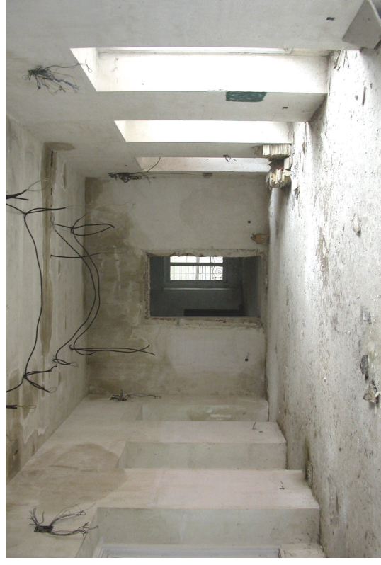
Crujía norte, entre el torreón de la duquesa y el torreón noreste.