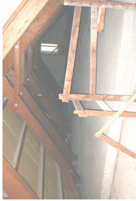
Planta tercera –bajo cubierta- y estructura de cubierta. Fot. Junio 2008

degradado de una manera ostensible ya sea por el vandalismo ya por la falta de mantenimiento. Ha sido necesario tapiar las ventanas y puertas ya que se han destruido cristalerías y contraventanas.