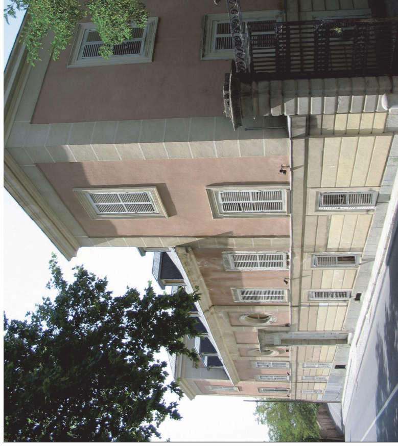
Fachada de palacio a la C/ de la Rambla. Fot. 2008