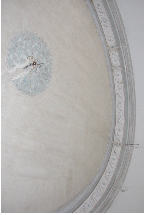
Techo del torreón sureste. Fot. Junio 2008

A los torreones situados al este, se accede a través de unos pasillos a norte y sur del zaguán. Sin tener el carácter de los torreones de los duques, son arquitectónicamente dos piezas igualmente interesantes.