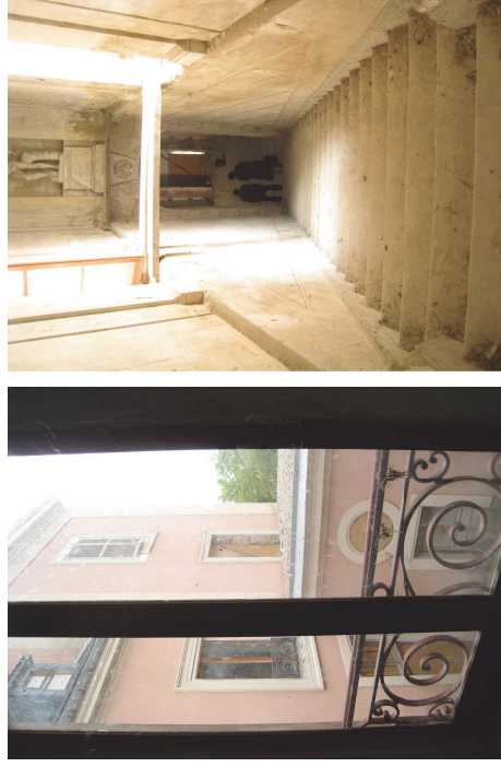
Vista hacia el patio sur desde las salas de la crujía central, y bajada de la escalera al comedor Fot. Junio 2008

Desde el zaguán se accede a la crujía central perpendicular al ala este, la cual se extiende hasta la galería porticada que da al jardín al oeste. Abre sus huecos a los patios norte y sur, y a ella desemboca la escalera que baja al comedor. Compartimentada originalmente en cuatro salas, al igual que en planta baja, actualmente sólo permanecen los muros de las dos primeras, los cuales no tienen ninguna función estructural debido a la nueva estructura que se construyó en la cubierta.