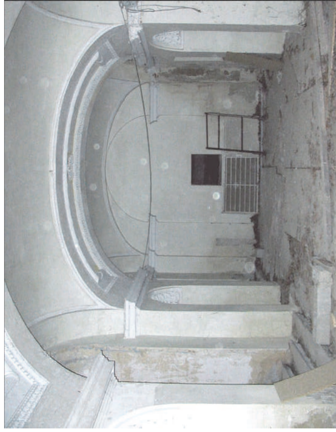
Vista del comedor de palacio en la planta baja. Fot. sin fecha

Esta planta baja tiene una superficie total útil de aproximadamente 700 m 2 sin incluir el patio de la derecha que tiene unos 100 m 2 y los de la izquierda con 14 m 2 cada uno.