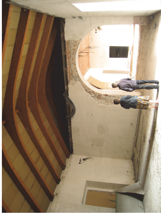
Vistas de las salas de la crujía central en planta primera y la cubierta de madera laminada. Fot. Junio 2008

En planta primera las salas, de mayor altura, adquieren un carácter más relevante respecto a las de planta baja, ya que en ella estaban las estancias de los Duques. Además es en esta planta donde los accesos cobran su verdadero protagonismo: al este, a través del zaguán que da a la calle, recorriendo este interesante espacio de dos alturas a través de sus dos escaleras. Y al oeste, a través de la escalinata imperial que da al jardín. Todo en esta planta está pensado desde un punto de vista escénico, tanto en la secuencia de los accesos a las salas, como de su relación con el jardín.